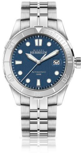
SEACOAST 1660/15B ¥137,000+tax